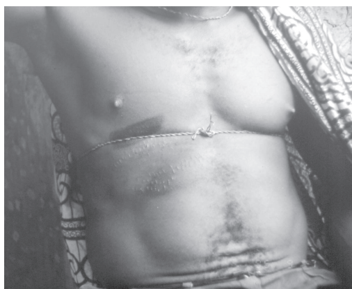
図2 "banjo"という脇腹の病の瀉血治療痕 (植物性の紐も治療薬)