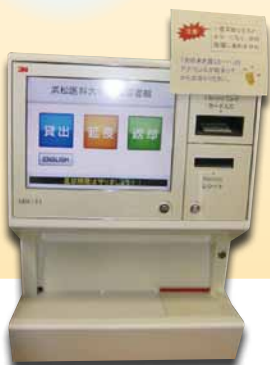
図書自動貸出返却装置

希望する資料が貸出中の場合、事前に予約することができます。 カウンターにてお申込みください。