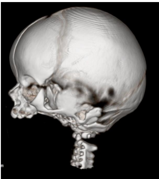
図2 頭部3DCT (側面)