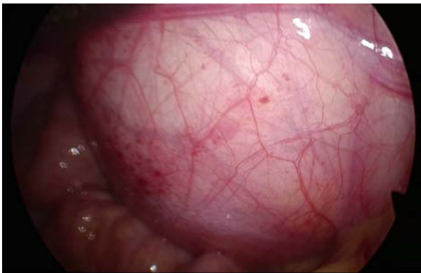
図 2 後腹膜腫瘍

手術所見：全身麻酔下に手術を開始した。臍部に 5 mm ポートを挿入。続いて左下腹部に 5 mm ポートを挿入した。腹腔内を観察すると、後腹膜腔に充実性の表面平滑な腫瘍を認めた(図 2)。腫瘍は左尿管を右腹側に持ち上げるように発育していた。上腹部、大網、消化管・腸間膜表面に播種を疑う所見は認めなかった。子宮と両側付属器は正常であった(図 3)。腹水は少量で腹水細胞診は陰性であった。外科医師に後腹膜腫瘍の術中評価を依頼したところ、小児外科による手術が適切と判断され、腹腔内の観察のみで手術を終了した。手術時間は 25 分、出血量は少量であった。